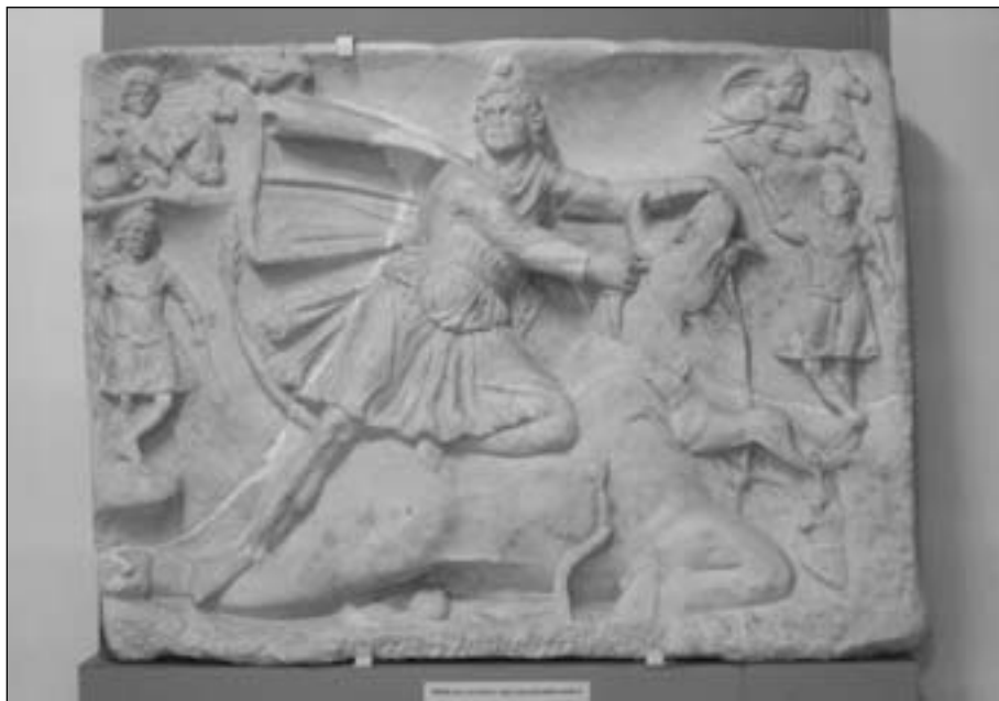
Az intercisai Mithras-relief (Intercisa Múzeum, Dunaújváros)

Ugyanez a helyzet az ábrázolások tekintetében is. A minden szentélyben (gyakorta több példányban is) megtalálható bikaölés-kép – tíz-tizenkét figurából álló, igen szoros, feszített kompozíció – egy-egy Róma-városi vagy al-dunai táborhelyi példányát ugyanúgy csak a művész/kőfaragó tehetsége, mesterségbeli tudása külön-